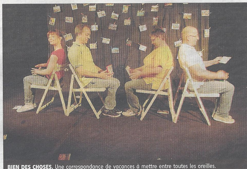
BIEN DES CHOSES. Une correspondance de vacances à mettre entre toutes les oreilles.

Autour de cette correspondance épistolaire, où la bonne humeur le dispute à la cocasserie, c'est une image de la France profonde, celle du siècle dernier, qui nous est proposée, celle qui ne se re-